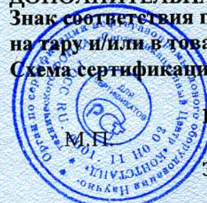
Схема сертификации: 2.

Знак соответствия по ГОСТ Р 50460 с надписью «Добровольная сертификация» наносится на тару и/или в товаросопроводительную документацию.